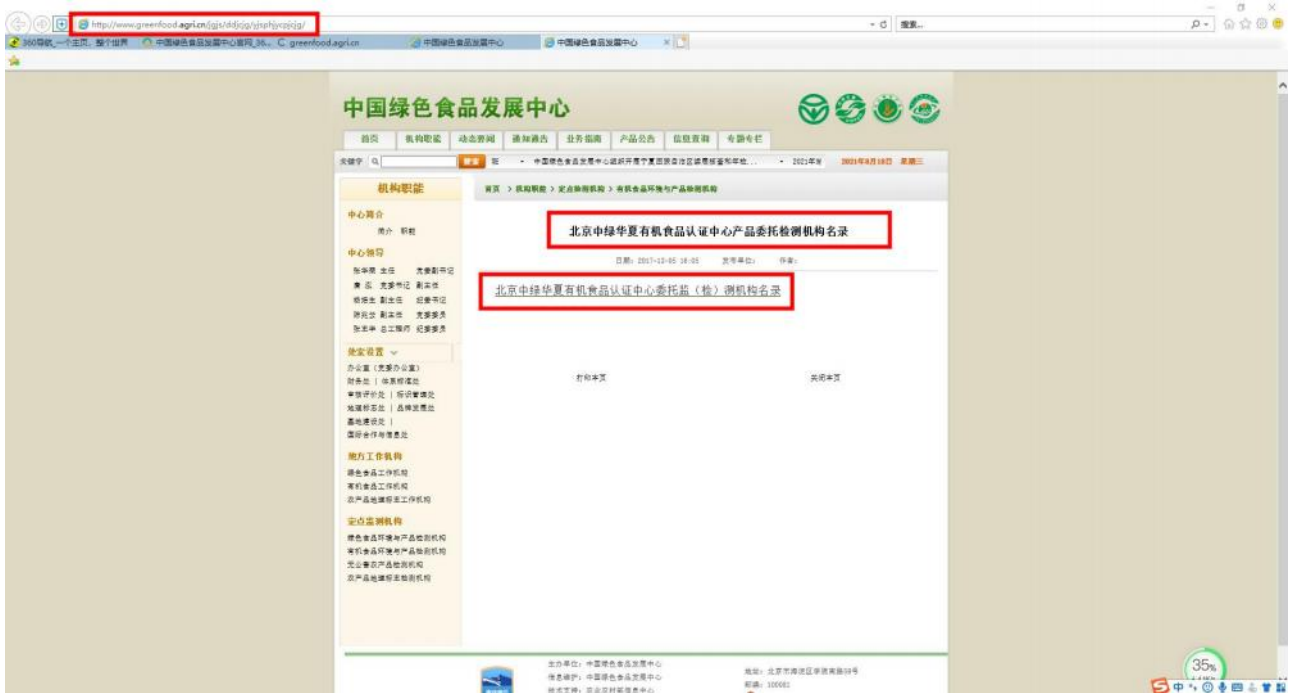
(1) 有机食品官网截图