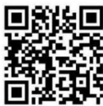
Zhengtong Certification Center

This certificate shall be subject to supervision and audit at least once a year within the validity period, and it shall be valid only if it is labeled as qualified by supervision.