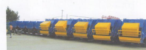
出口越南一批垃圾车