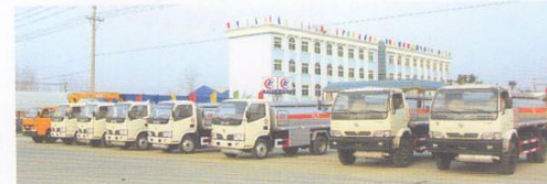
108台专用车出口到利比亚