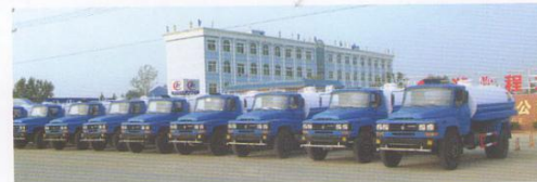
78台洒水车出口到尼日利亚