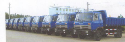
98台自卸车出口到加纳