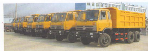
出口到科特迪瓦一批工程车