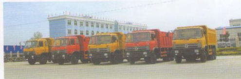
一批自卸支援联合国项目