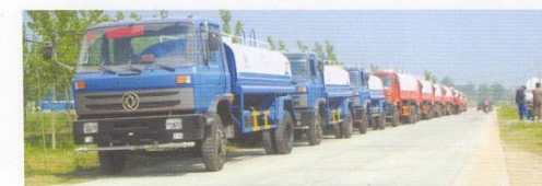
出口60台洒水车到刚果