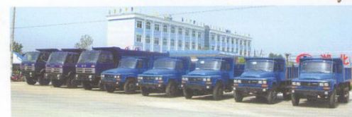
36台自卸车出口北美