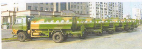
58台军用洒水车支援国防建设