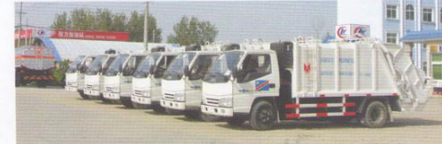
出口218台垃圾车到西非