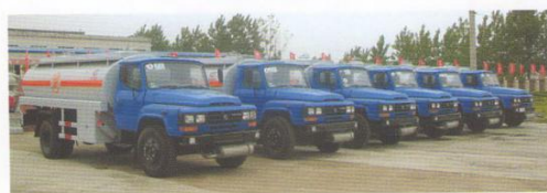
出口苏丹一批油车