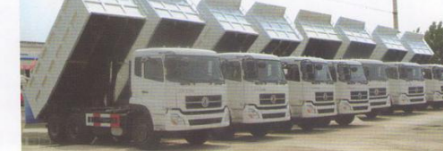
一批大吨位自卸出口到哈萨克斯坦